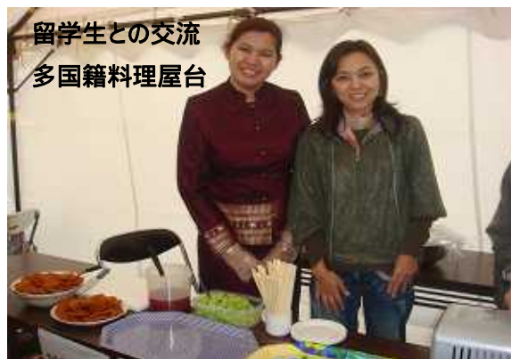
留学生との交流 多国籍料理屋台