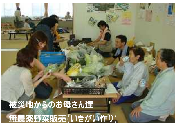
被災地からのお母さん達 無農薬野菜販売(いきがい作り)