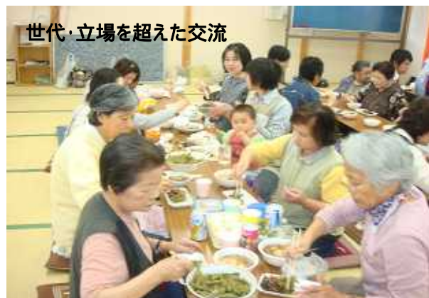
世代・立場を超えた交流