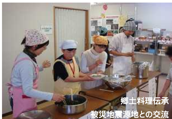
郷土料理伝承 被災地震源地との交流

郷土の特色を生かした事業(郷土料理、伝承文化、季節の地域行事など)紹介しながら地域間交流を図り郷土を知るきっかけ作り。他団体の企画、講座、催しなどに広く参加のきっかけを提供