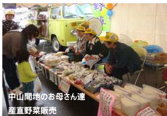
中山間地のお母さん達 産直野菜販売

にな市開催(毎月27日の地域・業種・世代・文化を越えた交流と、コミュニティビジネスの萌芽を応援する)、委託販売(になニ～ナ内に常設し、コミュニティビジネスの萌芽を応援する。にな市に参加できない方などの常設での受け皿とする)